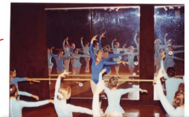
Der Ballettbereich wird vergrößert, es gibt Jazzunterricht und weitere Lehrer in dem Bereich.