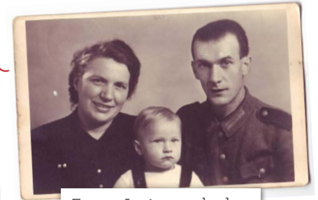
Eugen Junior macht das Familienglück perfekt.