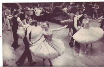
Formationen trainieren inzwischen in der Tanzschule und treten auf den Bällen auf.