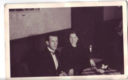
Sie lernen sich bei ihrer großen Leidenschaft, dem Tanzen kennen.