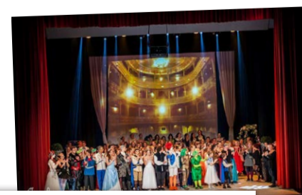
Das Weihnachtsmärchen wird zum Musical, das Dozententeam vergrößert sich, der Hip Hop ergänzt das Repertoire.