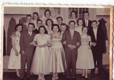
am Abend gibt sie Tanzkurse und ist so ihrem verstorbenen Mann und der gemeinsamen Leidenschaft ganz nah.