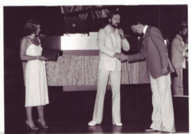
In den schönen Räumlichkeiten finden nun auch Tanzveranstaltungen statt.