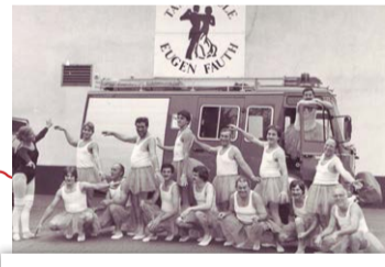
Inge choreographiert nun auch für externe Gruppen - mit viel Können, Witz und Charme.