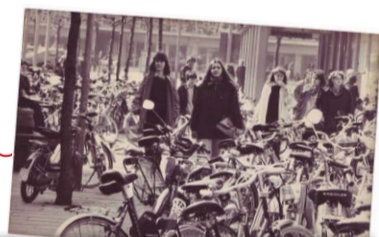
Legendär: Die Schulmappenparty zum Ende des Schuljahres.