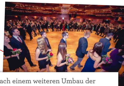
Nach einem weiteren Umbau der Tanzschule können hier nun auch große Abschlussbälle gefeiert werden.