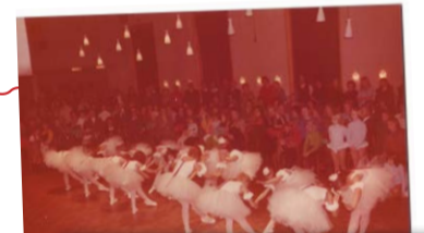
Die vielen Ballettklassen zeigen ihr Können in einer gemeinsamen Aufführung: Das Weihnachtsmärchen entsteht