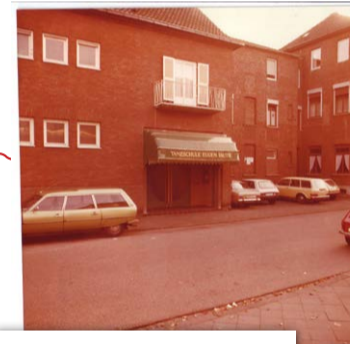
So werden neue, größere Räumlichkeiten auf der Poststraße bezogen.