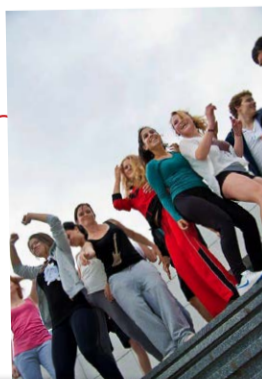
Kulturprojekte werden mit der Stadt Viersen und dem Land NRW realisiert.