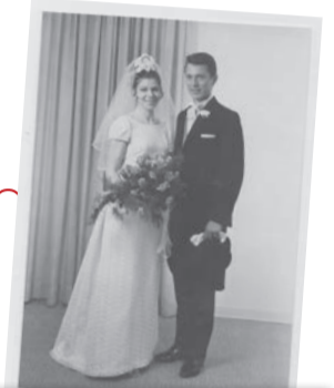
und so heiratet das junge Paar. Beide erlernen den Tanzlehrer - Beruf.