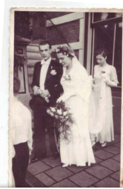
...und lieben. Sie gründen gemeinsam die Tanzschule Fauth.