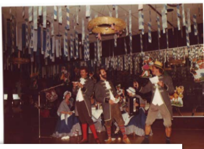
Das Tanzlehrerteam wächst auch, mit viel Herz und Engagement werden Tanzfeste gestaltet.